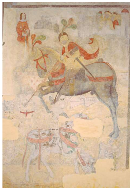
Saint Georges terrassant le Dragon