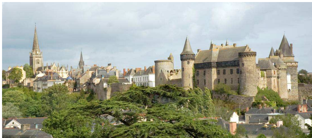
Vue générale depuis les Tertres Noirs

Depuis près de deux ans, l'ensemble des acteurs de la vie locale (services municipaux, associations, commerçants, scolaires...) travaillent à la préparation des différentes animations. Ces douze mois de fêtes, de couleurs, de spectacles et de rencontres culturelles offrent à tous les Vitréens, ainsi qu'aux visiteurs, la possibilité d'échanger et de se rassembler dans un esprit de convivialité autour de ces Mille Ans d'Art et d'Histoire.