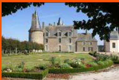
Le Château des Rochers-Sévigné

Après plus de deux années de recherches, c'est le 29 avril 2009 qu'est sorti l'ouvrage dans tous les points de vente habituels en France, notamment à la boutique du musée du château de Vitré, au prix de 39€.