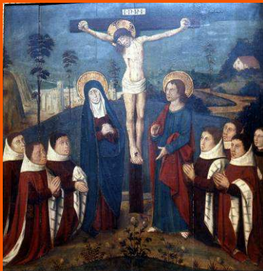
Retable des Marchands d'Outre-Mer (disparu)