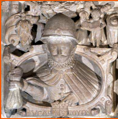
Détail de la cheminée Renaissance dans le Château de Vitré