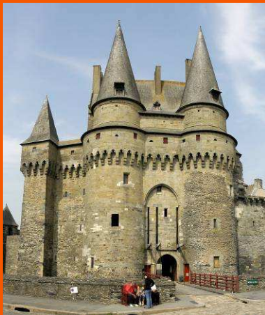
Le Châtelet du Château de Vitré