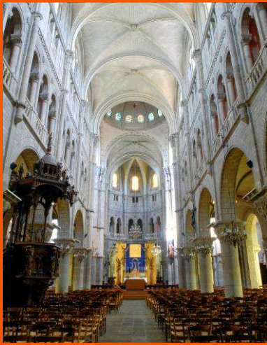
Intérieur de l'Eglise Saint-Martin