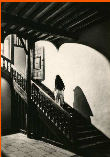
Le grand escalier du Monastère Saint-Nicolas