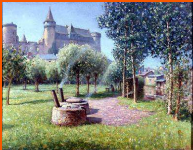
Raoul David, Les Chaudières